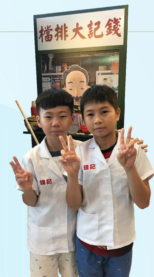
學員輕鬆愉快地從遊戲中學習理財。