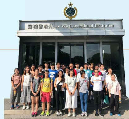
學員參觀懲教院所，學習奉公守法和支持更生的重要性。

學員到訪大欖懲教所及羅湖懲教所與在囚人士面談，通過互動交流，了解在囚人士「不一樣」的經歷。他們亦參觀了院所的主要設施，包括在囚人士的寢室、飯堂和工作間等，並由懲教職員講解其工作及入職條件。