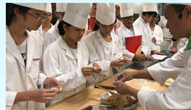
戴上雪白的廚師帽，學員做點心時似模似樣。

一班有志成為廚師及投身飲食業的學員戴上廚師帽子，在導師指導下於中華廚藝學院的專業廚房製作北方點心，更一同享用製成品。學員更獲專人帶領參觀學院設施，了解更多有關中廚培訓課程及入行的資訊。