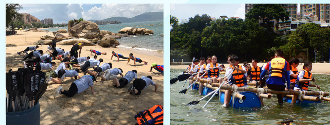
學員上山下海，以汗水和努力換來自我肯定。

學員在八鄉少訊中心成功完成為期五日四夜的領袖訓練，挑戰全港最長的100米高空吊索、參與黑夜定向及野外求生訓練，更動手製作木筏和作獨木舟體驗等。學員無論在體能、膽識、解難能力、團隊精神和領導才能方面也有所提升，同時加深對警隊工作的認識。