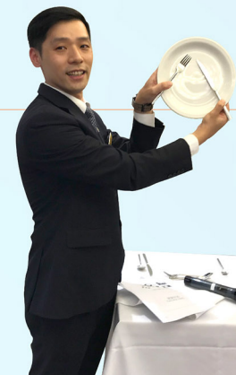
掌握禮儀有助增加學員於公眾場合用餐時的自信。