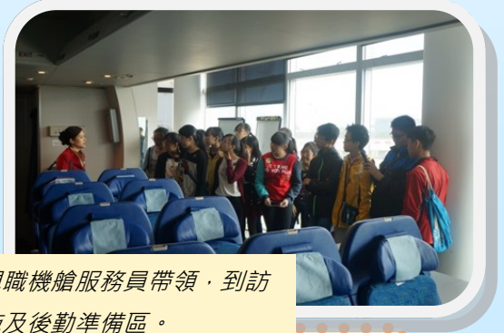
參觀隊伍由現職機艙服務員帶領，到訪多個訓練設施及後勤準備區。