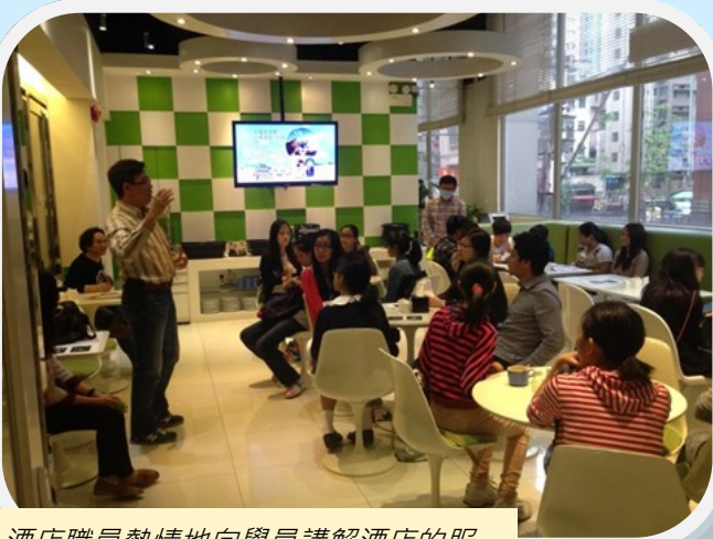
酒店職員熱情地向學員講解酒店的服務、設施及相關工作。

是次活動參觀了位於油麻地的精品酒店 – M1酒店，共邀請了來自浸信會愛羣社會服務處、工業福音團契及基督教勵行會共約30位學員出席。酒店安排了學員參觀多個部門，各部門負責人亦向參加者介紹了日常的工作詳情、分享趣聞及作親身示範，當中包括房務、銷售、前台服務、工程、行政等部門。學員除了可實地參觀各個設施外，亦從酒店工作人員學到了不同部門協作的重要性及營運挑戰。負責人也分享了酒店業的入行資訊及發展前景，同時亦不忘勉勵學員積極向上追尋理想，為他們在職業的選擇上提供了正面、新鮮又實用的資訊。