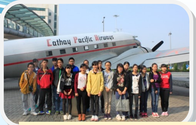
來自仁濟醫院羅陳楚思中學的兒童發展基金學員獲邀參觀位於香港國際機場內的國泰航空總部－國泰城。

翱翔天際是不少時下年輕人的夢想，他們憧憬投身航空行業，接觸世界各地的旅客、增廣見聞，以及獲得更多出國的機會。加上在電視、電影的薰陶下，近年航空業的職位更見搶手，每次舉辦招聘日皆見人山人海。要加入航空行業，除了成為機長外，機艙服務員也是不少年青人的選擇。2014年11月，國泰航空為參加兒童發展基金的學員安排合共4場的「參觀國泰城」活動，讓約100位來自校本試行計劃的學員有機會親身接觸及感受航空服務人員的工作及訓練地點。活動由現職機艙服務員帶領，走遍了工作人員的訓練設施及後勤準備區。學員了解到除前線人員外，後勤人員的工作對日常的飛行服務也十分重要。此次經驗讓他們在未來選擇職業的路向時提供了更多的資訊。