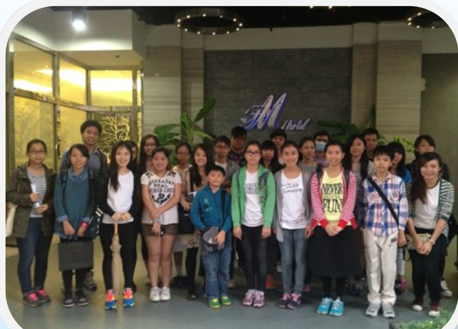
來自浸信會愛羣社會服務處、工業福音團契及基督教勵行會的兒童發展基金學員參觀了位於油麻地的M1酒店。

香港旅遊業發展蓬勃，除有地道的精品酒店之餘，亦有不少國際性品牌在本港建立分支，造就了大量職位，吸引青少年立志投身。部分的大專院校更有提供專門課程訓練酒店業人才。為讓青少年了解行業的特性及工作範疇，百仁基金於2014年11月8日特為兒童發展基金學員安排了酒店參觀活動，好讓他們親身了解酒店營運的各種細節，在選擇未來路向前先有更確切體會。