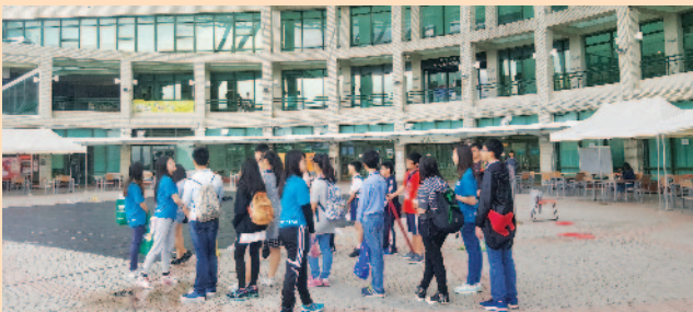
參觀中央大樓和圖書館。