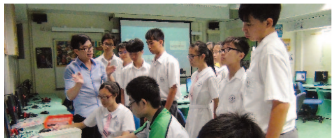
於香港中文大學了解全球定位系統。

試行計劃得到田家炳基金會的撥款支持，聘請了香港理工大學應用社會科學系醫療及社福研究網絡，協助推行計劃內的三大元素，並為學員、友師及家長提供適切的培訓和度身設計的活動。