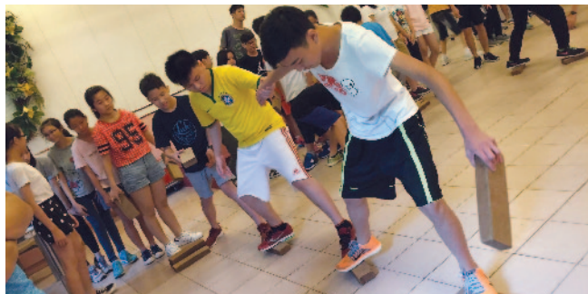
在營會進行集體遊戲。

「隨著經驗的累積，加上駐校社工的協助，學校在推行第二個計劃時已經駕輕就熟，可以獨立處理更多工作範疇。」