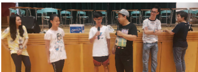
完成定向遊戲後分享得著和感受。

仁濟醫院羅陳楚思中學是首批試辦基金計劃的學校之一，於2014及2015年在校內推行分別名為「夢想成真」及「夢想飛行」兩個計劃，合共有超過100名學生參與。兩項計劃的內容除了包含「師友配對」、「目標儲蓄」及「個人發展規劃」這三大基本元素外，學校亦加入了獨有的品德教育課程「高效青少年七習慣」，伙拍區內青少年服務中心童軍知友社，由導師分別培訓學員、家長及友師，務求在學校、家庭和社區三個層面共建良好七習慣。