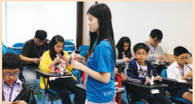
義務導師先教導手工藝「小老師」摺九重葛，待他們掌握技巧後，再教導其他學員。

在「小老師培訓班」中，義務導師會指導學員應如何「備課」。學員先研習義務導師準備好的教材，再構思方法教導其他學員。