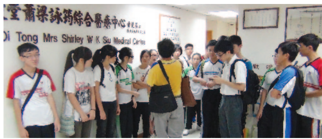
前往仁愛堂蕭梁詠筠綜合醫療中心了解中醫行業運作。

大學本身亦與優質師友網絡有緊密聯繫，除了能為計劃招募和培訓友師外，優質師友網絡開發的「優質計劃電子數據管理系統」更可統一處理所有行政工作，包括數據歸納和製作報告等；而理工大學亦會按系統計定的結果來製作研究報告回應計劃目標。