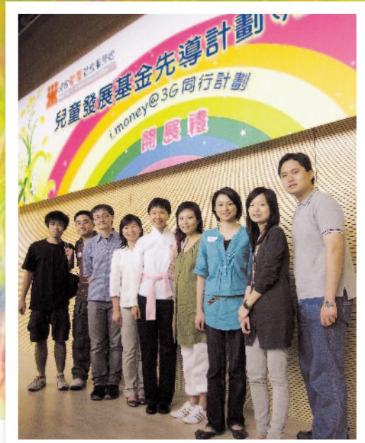
BCT銀聯集團在「兒童發展基金」2009年推出先導計劃時已參與，當時管理層及一眾同事出席開展禮支持計劃。

回想初次認識「兒童發展基金」，已是八年前的事，合作多年的社福機構浸信會愛羣社會服務處邀請我所屬的BCT銀聯集團參與計劃。尤記得機構的計劃督導社會服務處主任來到公司作簡介，當時便覺得計劃很有意義，留下了深刻印象。事實上，BCT亦一向重視企業社會責任(CSR)，深明CSR對企業及整個社會持續發展的重要性。而「兒童發展基金」計劃的宗旨和BCT的集團理念不謀而合，十分值得支持。