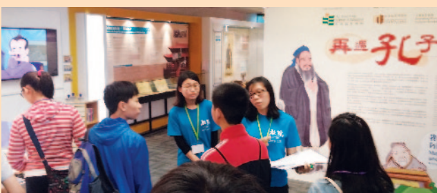
學員參觀教育博物館。

在「小老師培訓班」中，義務導師會指導學員應如何「備課」。學員先研習義務導師準備好的教材，再構思方法教導其他學員。