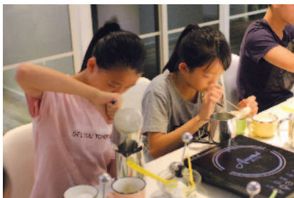
全神貫注嘗試咖啡拉花。

仁濟醫院羅陳楚思中學是首批試辦基金計劃的學校之一，於2014及2015年在校內推行分別名為「夢想成真」及「夢想飛行」兩個計劃，合共有超過100名學生參與。兩項計劃的內容除了包含「師友配對」、「目標儲蓄」及「個人發展規劃」這三大基本元素外，學校亦加入了獨有的品德教育課程「高效青少年七習慣」，伙拍區內青少年服務中心童軍知友社，由導師分別培訓學員、家長及友師，務求在學校、家庭和社區三個層面共建良好七習慣。