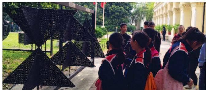
學習昔日颶風襲港時所懸掛的不同訊號。