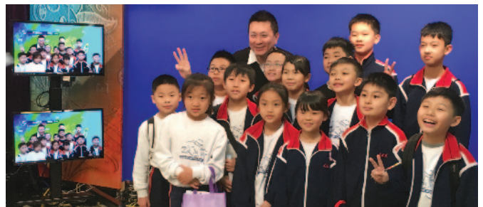
參觀天氣預告片段製作室，了解轉發片段至電視台播放的過程。