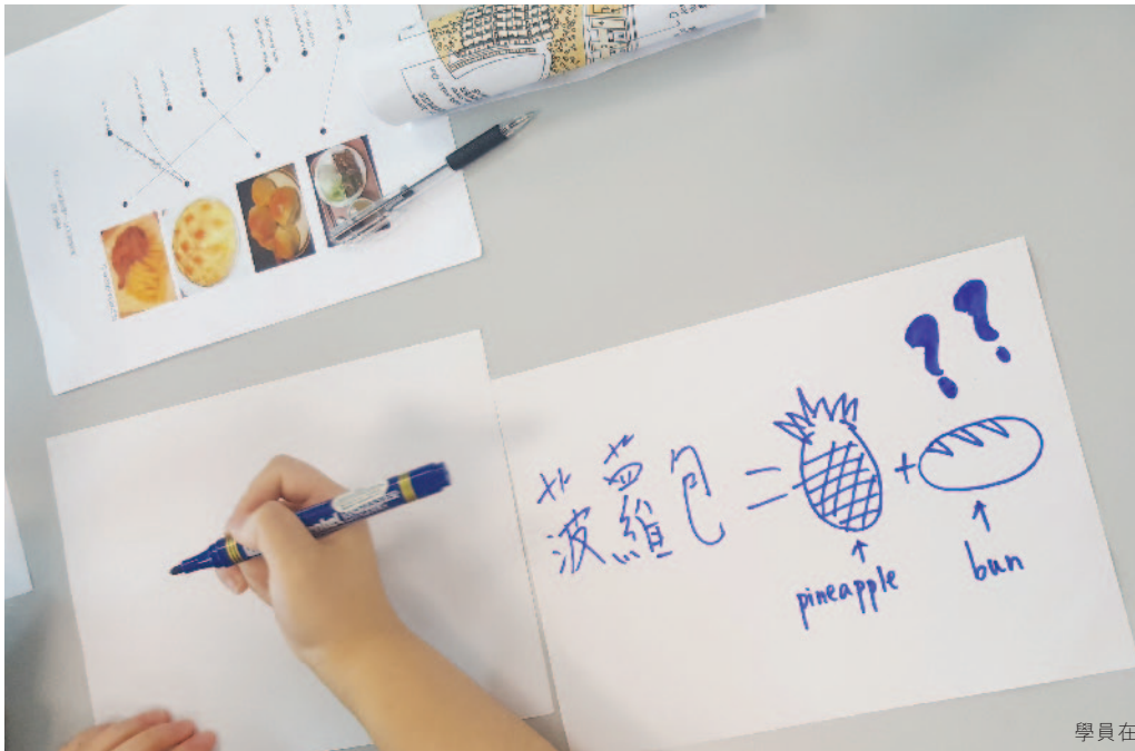
學員在「小老師教室」活動中學習編製教材。