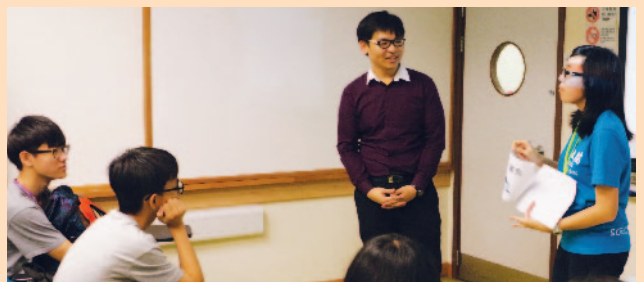
普通話組的學員細心聆聽義務導師講解「x」和「sh」兩個聲母發音的分別。

「小老師教室」環節讓各「小老師」有機會站在老師桌前，透過問答、運用笑話及插圖等方法，把所學的知識教授「學生」。