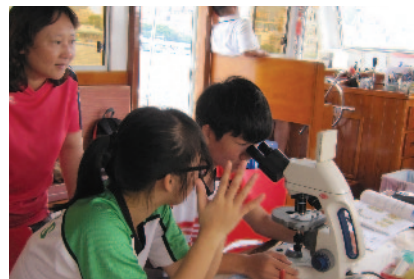
前往三門仔作水質探究。