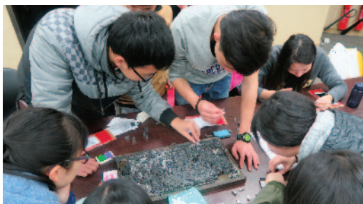
學員在活字畫工作坊更可以字粒創作藝術作品，體驗印刷文化。