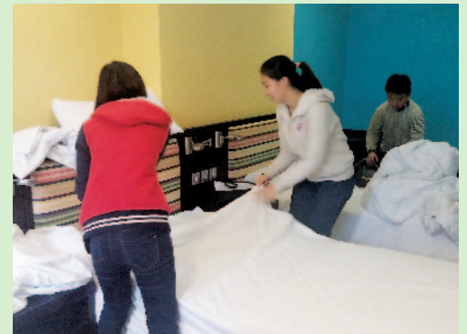
學員正嘗試為旅客入住進行準備工作。

在一月至二月期間，約130名來自八間營辦機構的學員已參加了三場「Y旅舍工作體驗」活動。他們透過講座、導賞、示範及親身嘗試整理房間的工作，認識前台與房務部門管理和運作，以及相關崗位的入職要求。