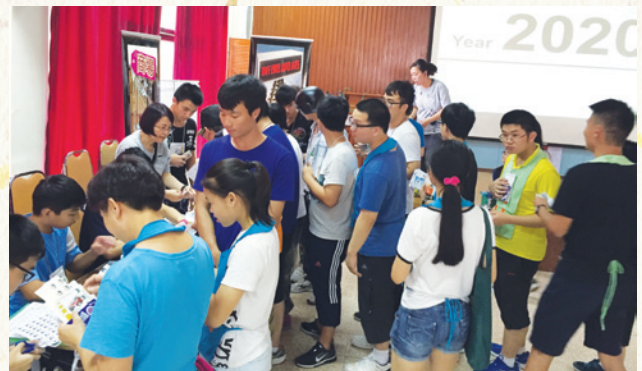
學員排隊購買生活必需品，並記錄在「生命冊」上。

學員在遊戲中也有機會學習理財。在「自由城」內，學員的收入主要來自工作，其他來源亦包括遺產、利息、投資等。他們除了要以收入來繳付日常生活開支外，同時也要預留部份作儲備，以支持自己在人生中的選擇和決定，與及應付生命中可能出現的變數。每項消費開支均須記錄在自己的「生命冊」上，至遊戲結束時作結算之用。