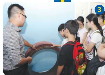
學員對海底天然氣管道的體積、物料和設計均感到好奇。