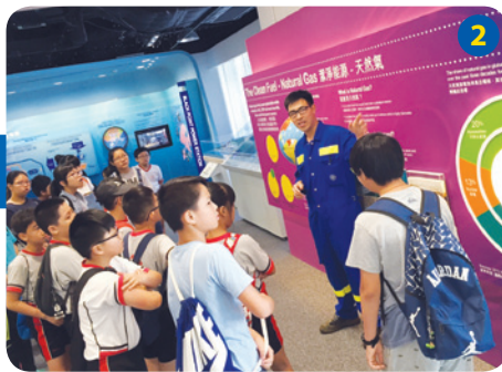
電力工程師向學員講解天然氣的來源及處理過程。