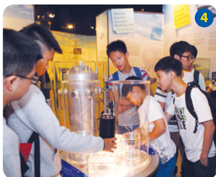
學員在廠內的「電力世界」以互動遊戲形式了解供電過程，並學習能應用於日常生活的節能小貼士。