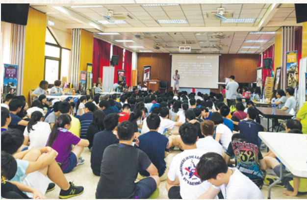
遊戲營內來自四間營辦機構的基金學員。

「目標驅動新人王」(Lifegame)是基金計劃內其中一個支援學員個人發展的培訓項目，由四間營辦機構聯辦，包括 浸信會愛羣社會服務處、基督教勵行會、工業福音團契及城市睦福團契 。在 泉石復興事工 帶領下，這個三天兩夜的遊戲營讓近200名學員經歷真實人生中有機會遇到的挑戰、挫敗和機遇，啟發他們反思人生目標，明白個人發展規劃的重要性。