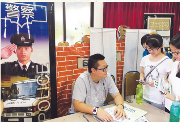
「自由城」內的考官正與有意投身警隊的學員進行面試。

與現實世界一樣，「自由城」裏有社區、政府、公營機構、私人公司、商鋪食肆、學校、教會、娛樂場所等，為村民在生活上提供不同支援。