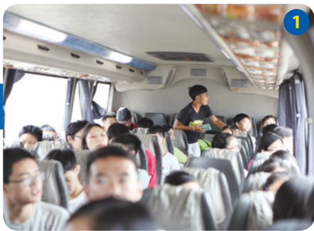
乘坐旅遊巴作環廠遊。

有見電力與大眾生活息息相關，兒童發展基金安排了80名學員，與 中華電力有限公司 （中電）的工程師直接對話，了解電力工程師的職業及入職條件，並參觀位於屯門的龍鼓灘發電廠和青山發電廠，以互動遊戲了解發電和輸配電的過程，加深對電力行業的認識，令有志投身工程師行業的學員獲益良多。中電的工程師為活動作總結時，更鼓勵一眾學員道：「工程師的工作包含很多範疇，亦有不同層次。這個年紀可先為自己訂立一個目標，然後逐步按計劃實踐。」