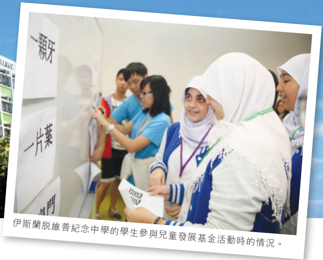
伊斯蘭脫維善紀念中學的學生參與兒童發展基金活動時的情況。