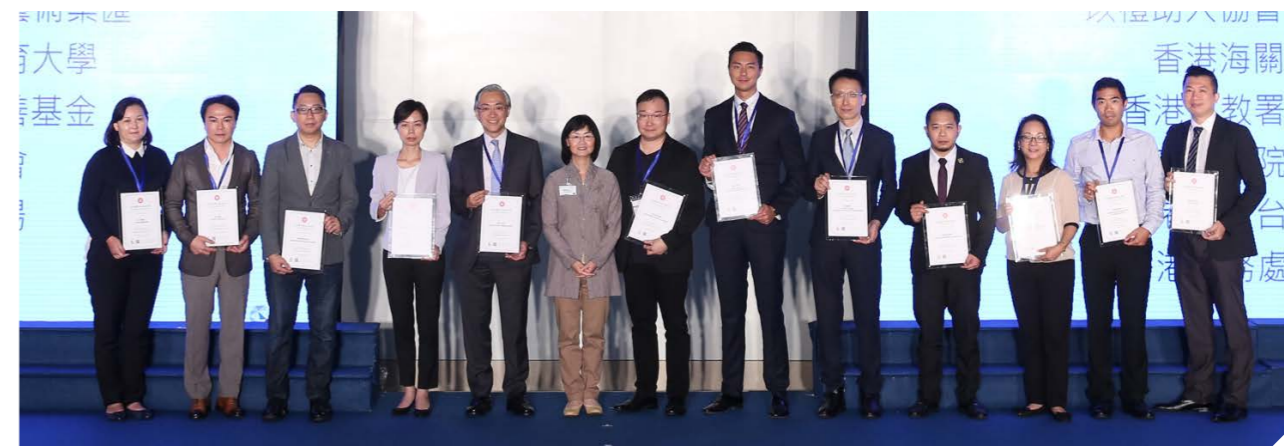
支持機構在台上獲頒嘉許狀後拍照留念。