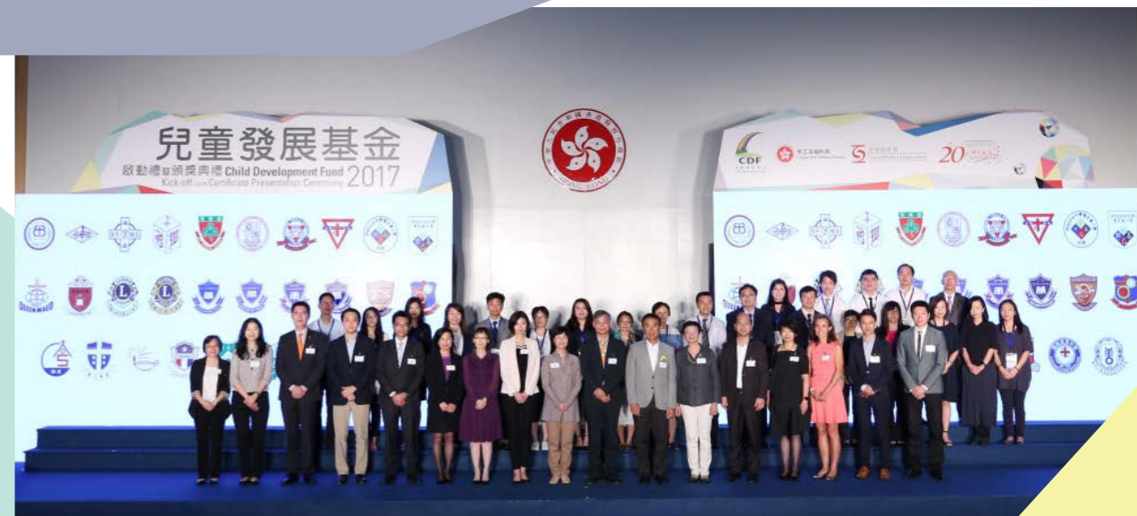
第三及第四批校本計劃代表合照。