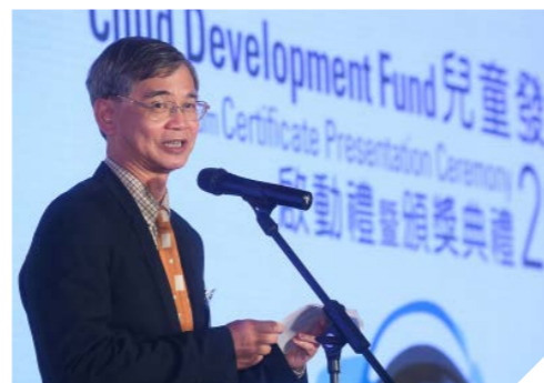
勞工及福利局局長羅致光博士在致辭時表示，勞工及福利局委託香港大學進行了一項評估研究，研究證明基金計劃能有效提升基層兒童在資源管理和未來規劃的能力，擴闊個人網絡，以及建立持續儲蓄習慣。這些條件對學業和將來的事業發展皆有很大好處。

今次典禮以「太空學員飛越天際任務」為主題，寓意結業學員在人生的路途上，如太空人般抱持積極的態度和希望，去探索未知、超越自我，走得更高更遠。