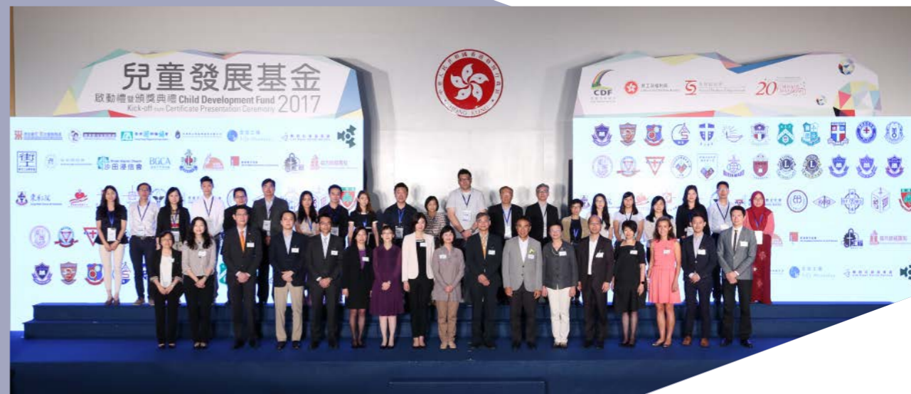
首批校本及第四批非政府機構計劃代表合照。