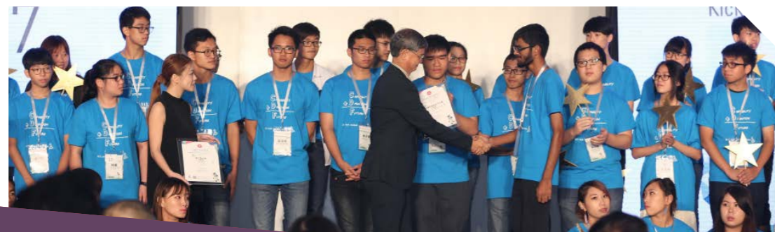
結業學員逐一上台接過嘉許狀。