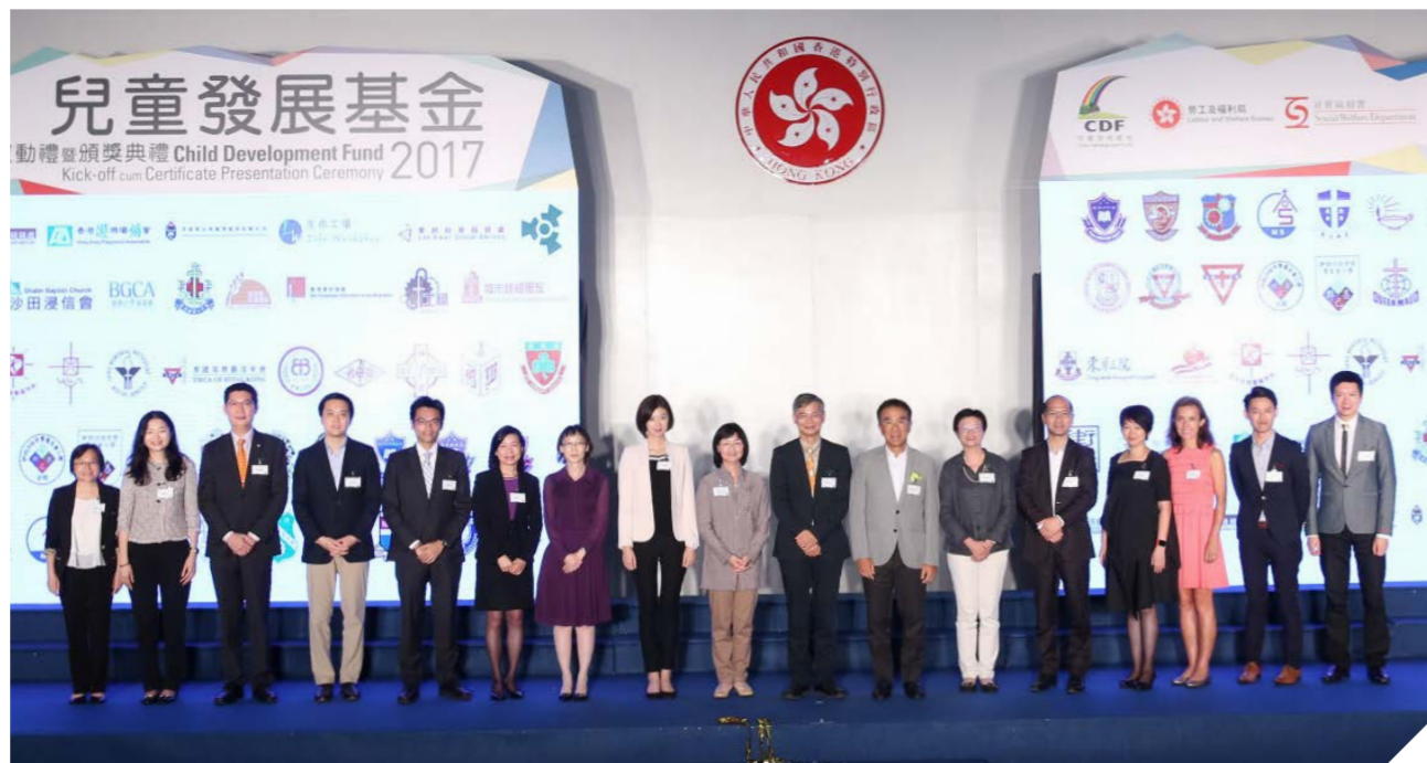
嘉賓及基金督導委員會委員合照。