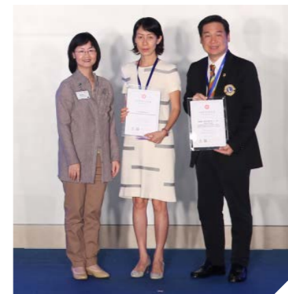
勞工及福利局常任秘書長張瓊瑤女士(左)頒發嘉許狀予基金的策略伙伴——兒童發展配對基金及國際獅子總會中國港澳三〇三區。兩者自基金成立開始，一直為計劃提供配對捐款和友師方面的支援。

這些企業和機構分別與勞工及福利局和計劃營辦機構協作，提供配對捐款、動員友師，以及安排能夠豐富經驗、擴闊眼界的增值活動，讓學員能透過計劃向自己的理想邁進。