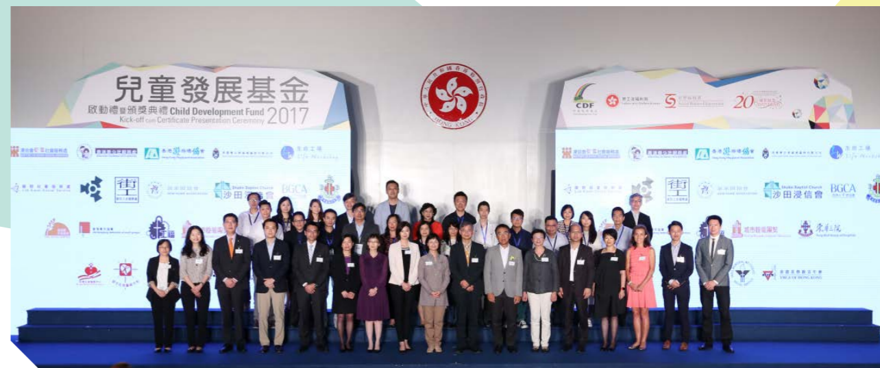
第六批非政府機構計劃代表合照。